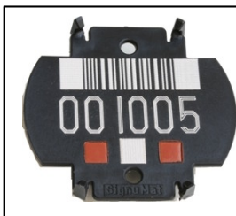
Trommellabel vor Okt 2010

Lebacher Straße 152-156 66113 Saarbrücken Fon : +49 (0)681 97 11 -127 Fax : +49 (0)681 97 11 -19127 E-Mail sbalzert@faberkabel.de