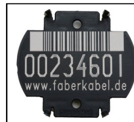
Trommellabel seit Okt 2010